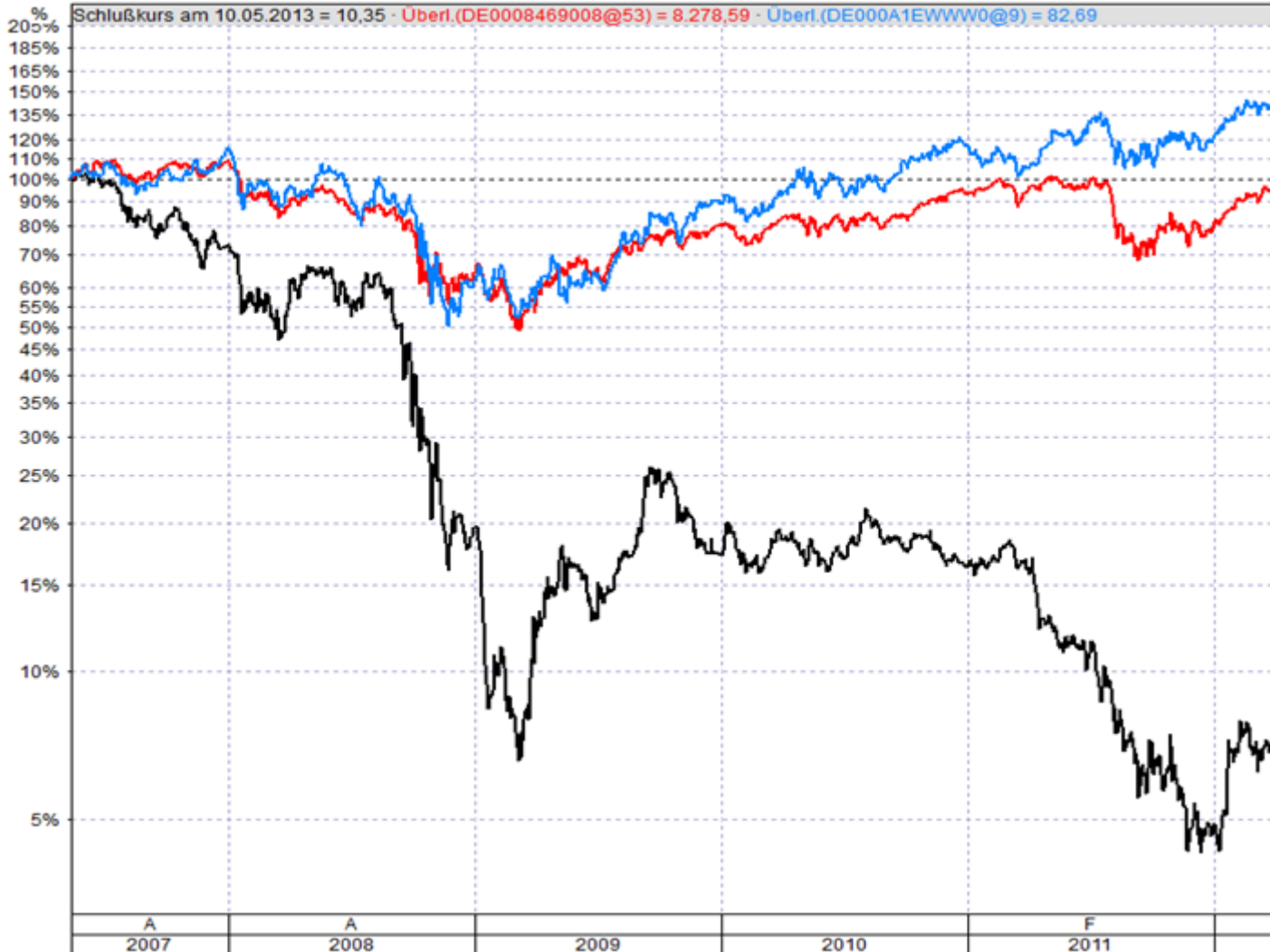
Abb. 3 Überlagerungschart Gewinner und Verlier im DAX über sechs Jahre

Die Adidas Aktie schafft über den Betrachtungszeitraum ganz entspannt eine Verdoppelung, der DAX-Index liegt mit knapp 10% noch im Plus und die Commerzbank Aktie bekommt die rote Laterne mit – 96%.